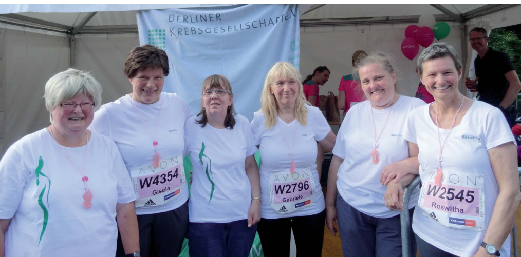
Team Hoffnung sammelte 1.321 Euro und damit die höchste Spendensumme, die je ein Laufteam gesammelt hat

Ein neu formiertes Laufteam hat mehr als 1.300 Euro für Brustkrebspatientinnen gesammelt. Es nennt sich „Team Hoffnung“